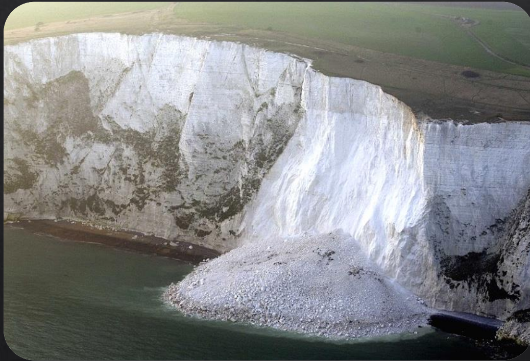
Dover (Angleterre), 2013